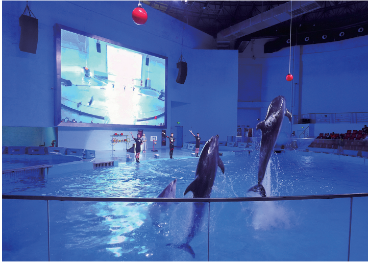
学生们在极地海洋世界观看海豚表演。

站在新的历史起点上,温州大学全体师生将以只争朝夕、不负韶华的奋斗姿态,全力推进特色鲜明的水水平教育研究型大学建设,努力在建设“重要窗口”中彰显担当,展现作为!